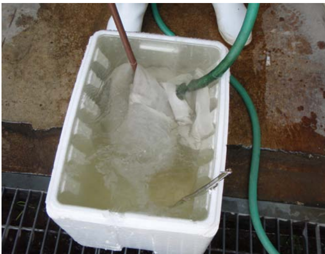
▲温湯種子消毒の様子

みつばの温湯種子消毒については、部会の先進農家が、水なす種子の温湯による休眠打破技術にヒントを得て、先行して独自に試験を行っていました。農の普及課では、その取組に注目し、その技術を生産農家共通の技術として確立しようと、環境農林水産総合研究所に協力を要請して、現地試験に取り組みました。