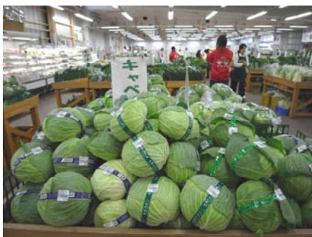
▲こーたり～な 店内の様子

「こーた」は「幸多」「り～な」は「利菜」で「幸多利菜」多くの幸せを運び、良くできた野菜、英文表記では「Court Arena」野菜たちが主役になって笑顔のお客様に囲まれた「中庭劇場」(コート・アリーナ)が訛って「こーたり～な」というネーミングだそうですが、店内には水なすやキャベツ、ふき等泉州の特産品をはじめ、しゅんぎくやほうれんそう等新鮮な野菜類が所狭しと並び、地元で生産されたブランド豚肉やこだわり卵などの畜産品も消費者に喜ばれています。