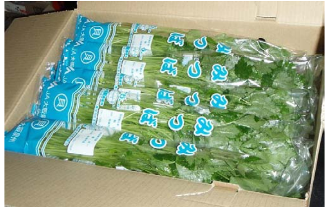
▲出荷を待つエコ栽培みつば

みつば部会では、数年前からさらにブランド化を進める一環として、部会全体で「大阪エコ農産物*」の認証を受け、その課題を検討した結果、夏期の病害虫防除をクリアする減農薬栽培技術として温湯による種子消毒に着目しました。