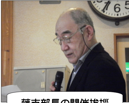
藤支部長の開催挨拶