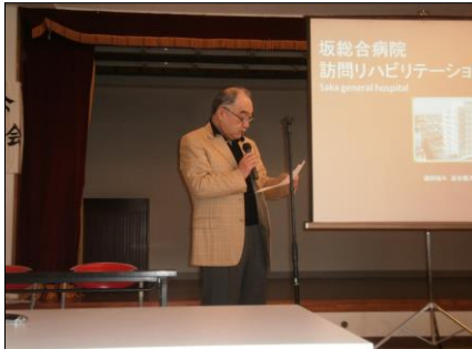
藤支部長の開催挨拶