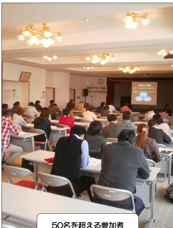
50名を超える参加者