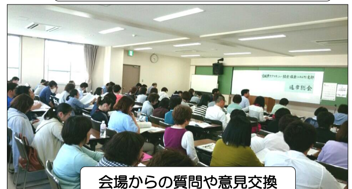
会場からの質問や意見交換

塩釜支部(塩釜市・多賀城市・松島町・七ヶ浜町・利府町)はこれからも連携を密に頑張ります。よろしくお祈い致します!