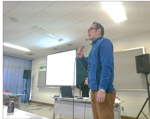
安住副支部長の開催挨拶