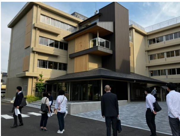
写真 金沢未来のまち創造館見学会