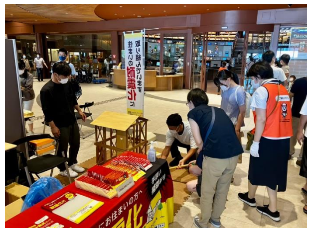
写真 備えて安心!いしかわ防災キャンペーン

令和4年9月4日(日)に、住宅の耐震化に関する普及啓発を目的とし、石川県立図書館で、標記キャンペーンの一環となる防災PRイベントに参加しました。耐震模型を用いて、多くの一般県民の方に、地震への備えの重要性を知っていただきました。