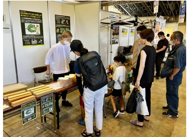
写真 いしかわ環境フェア2022

令和4年8月20日(土)、21日(日)に、建築物の木材利用等に関する普及啓発を目的とし、石川県産業展示館4号館で、いしかわ環境フェア2022に参加しました。ポスター掲示、木の匂い・手触り体験や積み木の模型体験等を通じて、100名以上の一般県民の方に、建築物の木材利用が温暖化防止などの持続可能な環境づくりに貢献できることを知っていただきました。