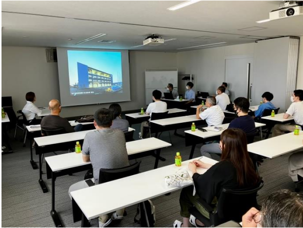
写真 一級建築士製図試験事例