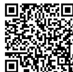
図 青年委員会紹介動画への二次元コード

本稿を通じて、当委員会の活動を知っていただければ幸いです。また、当委員会の紹介動画をYouTube上に公開していますので、是非ともご覧ください。また、活動に関心がある40歳未満の建築士の方は、メールアドレス( ishishikaikouhou@gmail.com )宛に連絡ください。石川県建築士会の青年委員による取組を一緒に考えていければと思います。どうぞよろしくお願いいたします。